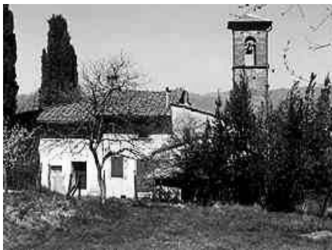
Barbiana - Firenze

L'Azione Cattolica ha al suo interno una ricchezza di testimonianze di vera vita cristiana e noi col nostro peregrinare vogliamo cercare la presenza di Dio nelle meraviglie della sua creazione.